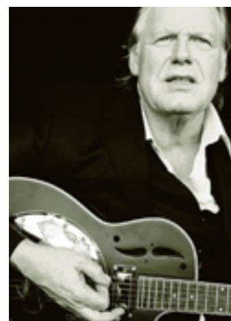
Highlight am Family-Day (12. Mai): um 14 Uhr tritt Country-Barde „Hey Boss, ich brauch' mehr Geld“ und Trucker-Ikone Gunter Gabriel auf