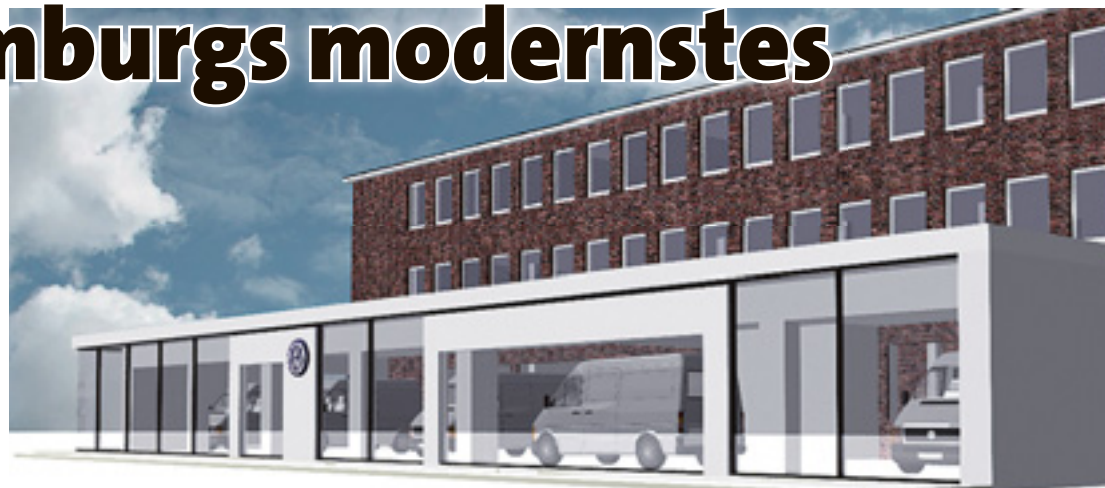
Das Wichert-Nutzfahrzeugzentrum ist ein gelungener Mix aus alter Substanz und ökologisch nachhaltigem Neubau. Fläche: 25.000 qm, Invest: 9,5 Mio. Euro